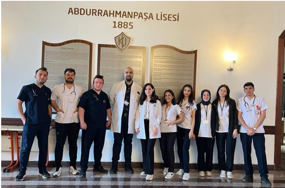
Görsel 5: Aday öğrencilere yönelik düzenlenen Sağlık Bilimleri Fakültesi Hemşirelik Programı tanıtımı etkinliği (20.03.2024)