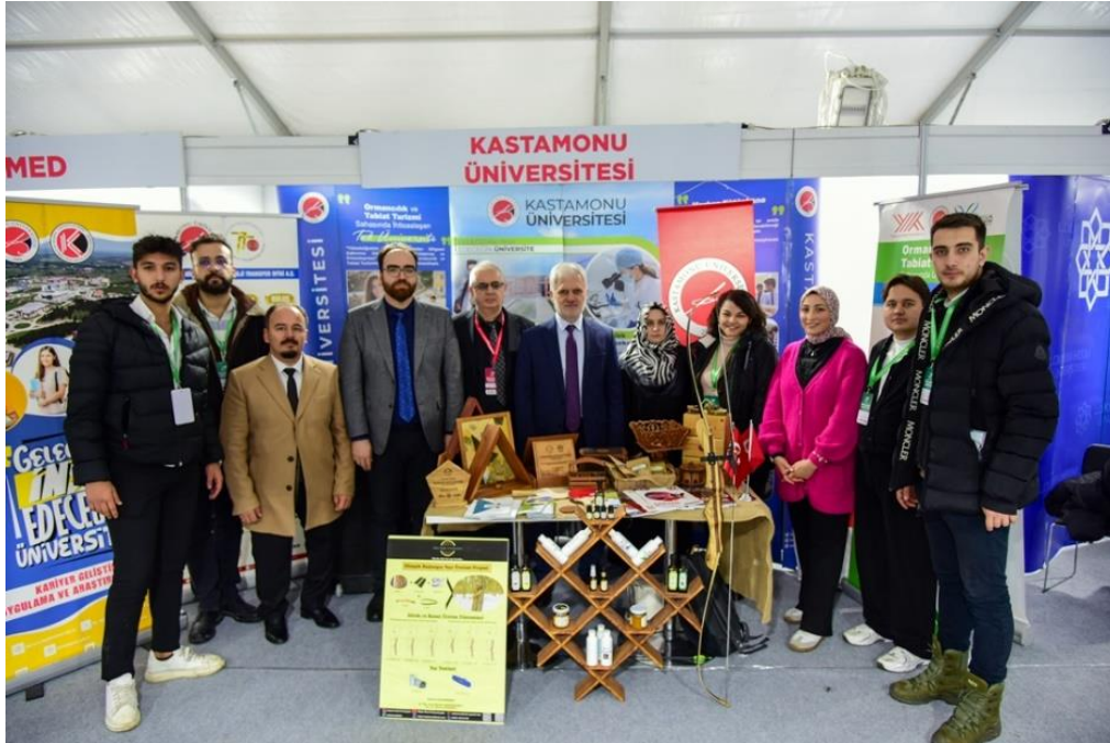
Görsel 17: BATIKAF'24 Kastamonu Üniversitesi Standı

Cumhurbaşkanlığı İnsan Kaynakları Ofisi (CBİKO) koordinesinde Bolu Abant İzzet Baysal Üniversitesi ev sahipliğinde 16 – 17 Aralık 2024 tarihlerinde düzenlenen “Batı Karadeniz Kariyer Fuarı” (BATIKAF'24) Üniversitemizin de içinde bulunduğu 19 üniversitenin paydaşlığı ve katılımıyla tamamlanmıştır. Üniversitemizin fuar hazırlık süreçleri ve fuara katılacak olan öğrenci ve personellerin koordinasyonu merkezimizce sağlanmıştır.