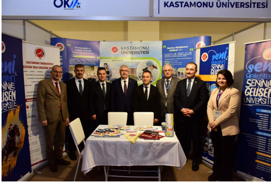
Görsel 16: OKAF'24 Kastamonu Üniversitesi Standı